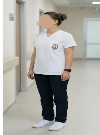
Resim 2. Klinik forma