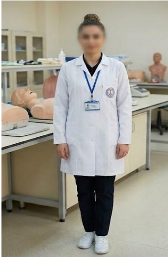
Resim 1. Laboratuvar Önlüğü